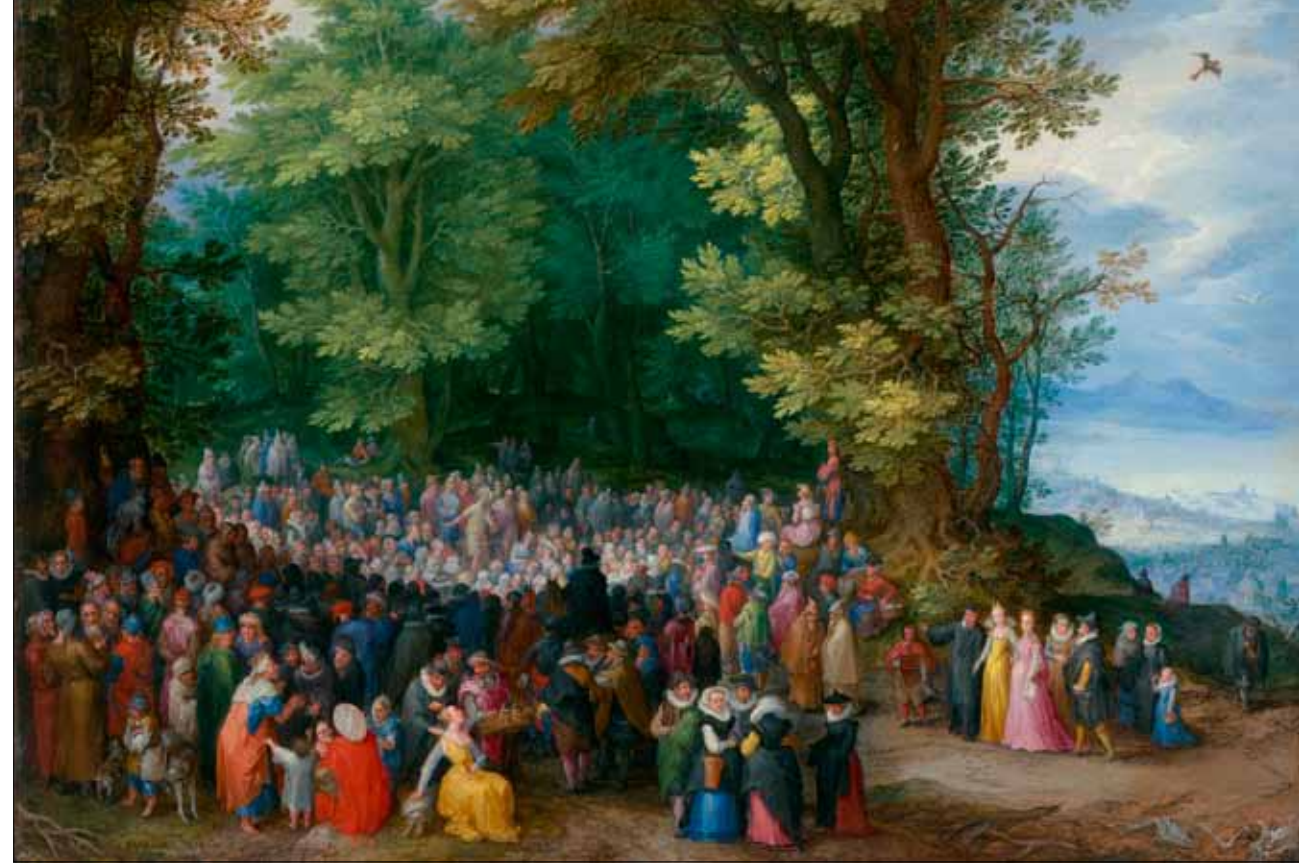
Jan Bruegel il Vecchio, Il discorso della montagna , 1598, Los Angeles, Getty Museum

Ma è appunto ciò che chiede il vangelo: di non arrendersi, di non essere indifferenti