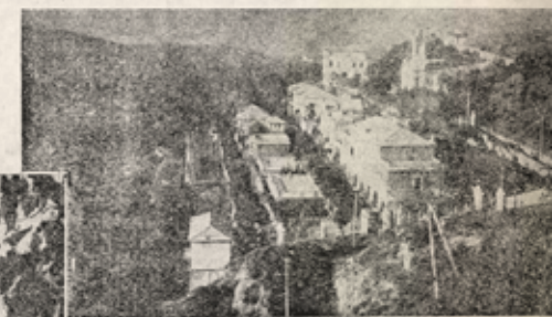
Complesso delle abitazioni dove han trovato asilo tanti infelici