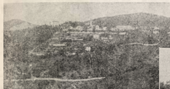
Veduta generale dei Camaldoli, sulle sponde di Genova