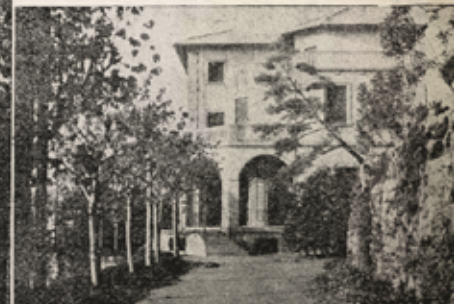
La villa destinata a casa di riposo per Sacerdoti bisognosi di assistere

Villaggio della Carità "D. Luigi Orione", monumento vivo di amore che Genova ha dedicato al Padre dei poveri nell'anno del pio transito (1926)