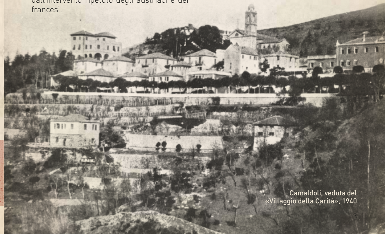
Camaldoli, veduta del «Villaggio della Carità», 1940