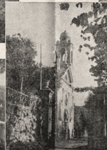
Una delle due chiese