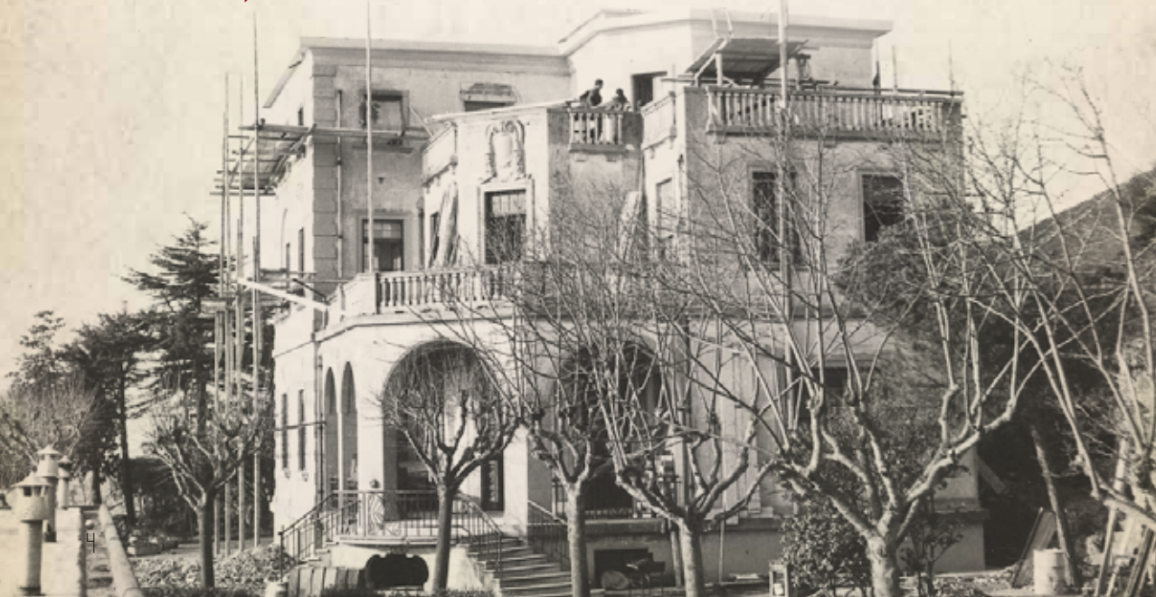
Camaldoli, il "castello" in via di restauro, 1940