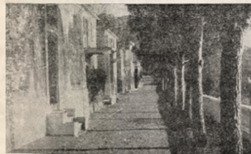
Nel silenzio e nella pace i poverelli trascorrono giorni consolati